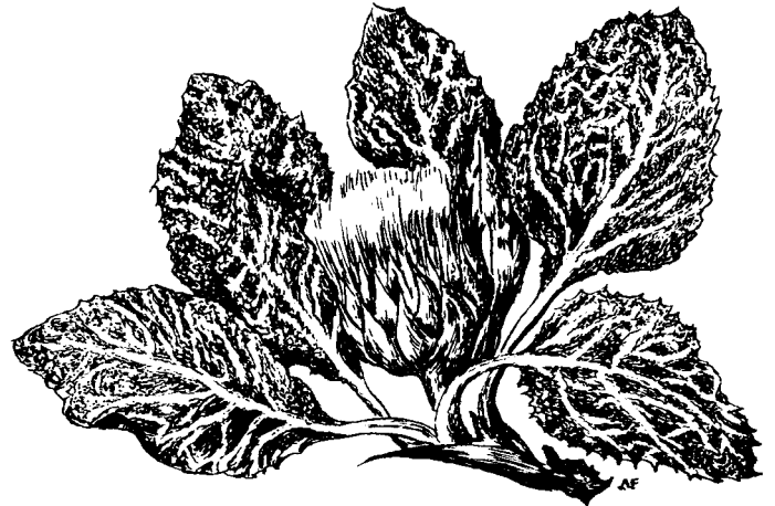
Chardon de Bérard, Bérardia laineux Berardia subacaulis Vill.

Ont participé à la réalisation de ce numéro : Roland CHEVREAU, Jean-Claude COLLINET, Jean GUERIN, Frédéric GOURGUES, Pierre SALEN