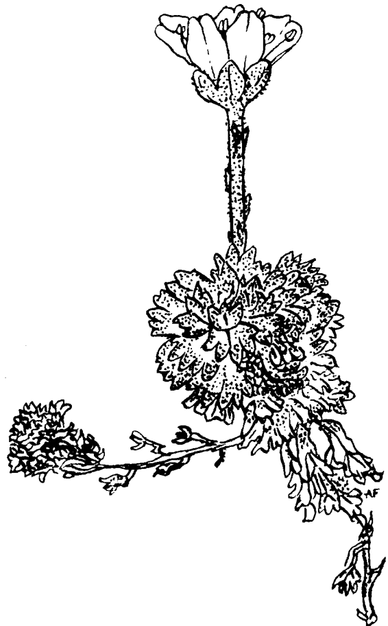
Saxifrage du Dauphiné

Saxifrage exarata Vill. subsp. delphinensis (Rav.) Kerguélen (Syn. Saxifraga delphinensis Rav.).